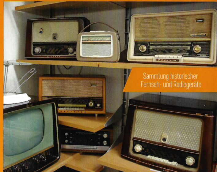
Sammlung historischer Fernseh- und Radiogeräte