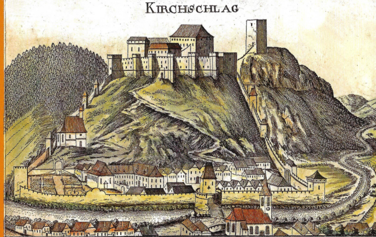
Vischer-Stich aus dem Jahre 1672