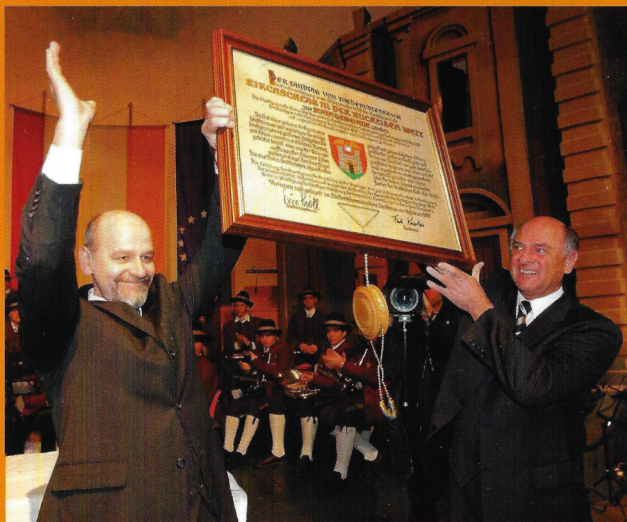
Bürgermeister Franz Pichler-Holzer und Landeshauptmann Erwin Pröll bei der Überreichung der Stadterhebungsurkunde am 16. Februar 2003

Darüber hinaus wurden für die Sonderausstellung zahlreiche Erinnerungstücke an die Kirchschiager Vergangenheit zusammengetragen, wie z. B. Geschenk- und Erinnerungsgaben an verdiente Kirchschiager, historische Ortsprospekte, Kirchschiager Souvenirs und vieles andere mehr.