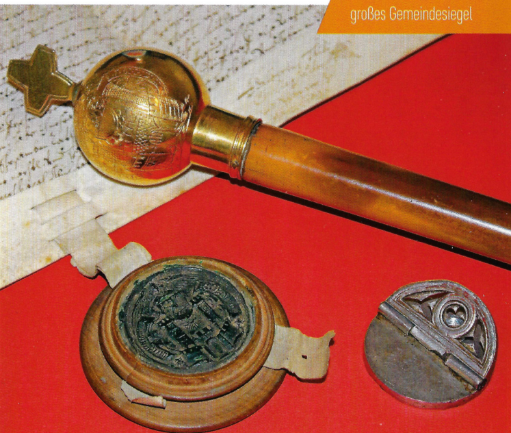
Marktrichterstab und großes Gemeindegel

Aber auch die neuere Zeit ist durch Exponate, Bilder und Dokumente vertreten. Bei dieser Vielfalt ist sicher auch für Sie ein interessanter Bereich dabei. Kommen Sie vorbei und versinken Sie in der spannenden Zeitgeschichte. Die ehrenamtlichen Mitarbeiter freuen sich auf Ihren Besuch!