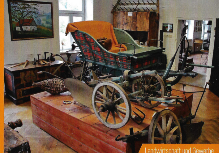
Landwirtschaft und Gewerbe