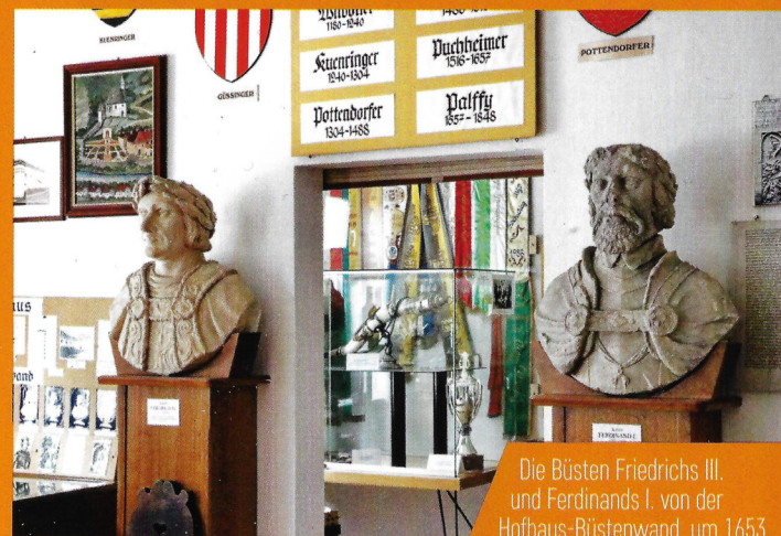
Die Büsten Friedrichs III. und Ferdinands I. von der Hofhaus-Büstenwand, um 1653